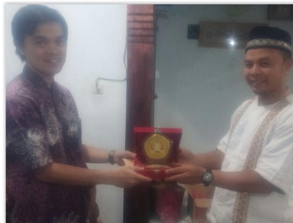
Gambar 4. Penyerahan Plakat