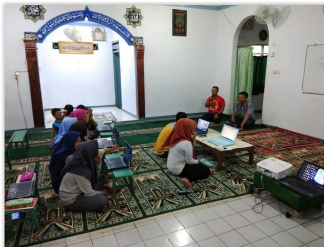
Gambar 2. Pembukaan Kegiatan oleh RT Setempat