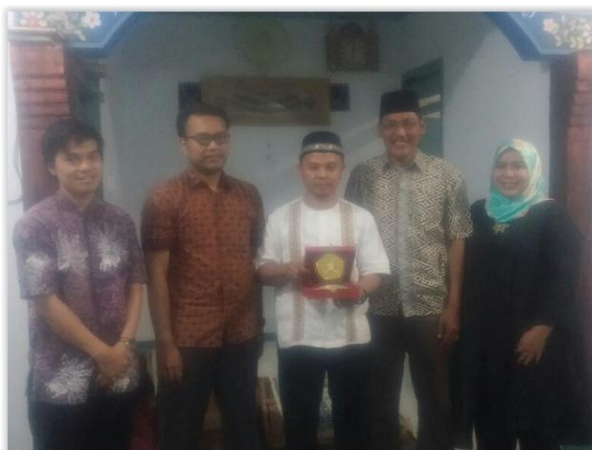
Gambar 5. Foto Bersama dengan Pengurus RT dan RW