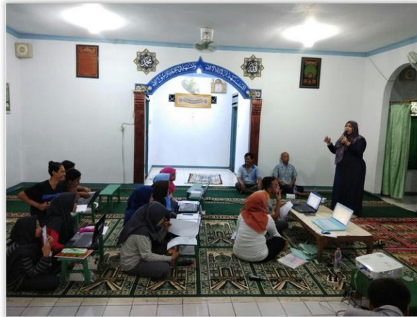
Gambar 3. Pemberian Materi