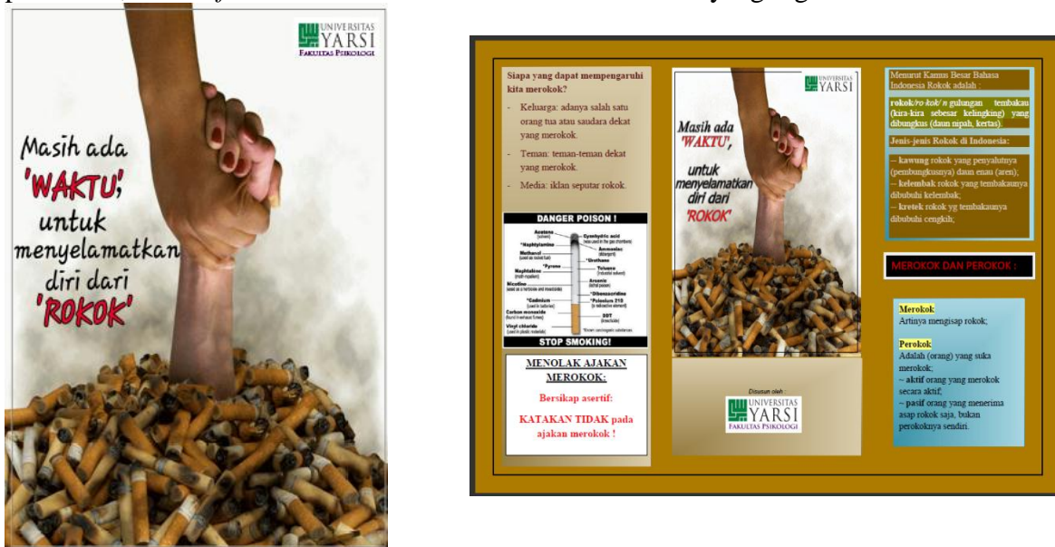
Gambar 1. Contoh poster dan leaflet

Kegiatan yang dilakukan merupakan salah satu bentuk promosi kesehatan berupa psikoedukasi, yaitu memberikan informasi kepada masyarakat melalui poster, presentasi, dan leaflet . Berikut adalah contoh bahan dan alat yang digunakan: